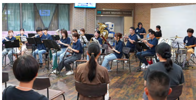
「MEIKAI課外活動LIVE!」での吹奏楽部

パスに参加し、日頃の成果を披露した。参加者からは「課外活動の様子が見られてよかった」「課外活動を体験できてよかった」といった声が寄せられた。