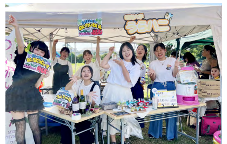
販売を行うホスピタリティ・ツーリズム学部の学生たち

参加した学生からは「暑い中、お祭りに足を運んでくださった地域の方々や子どもたちと交流ができ、貴重な機会になった」との声が聞かれた。