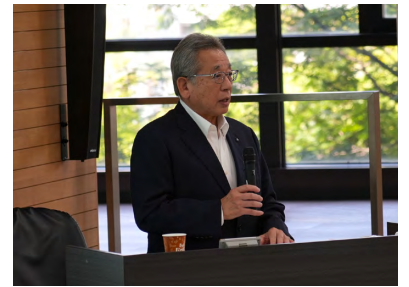
JAいちかわ今野組合長 講演の様子

学生たちは、今まで曖昧だったSDGsの理解が明確になったようで「具体的な取り組みの話はとても興味深く、意外と身近なことで自分も役に立てそう」という声が聞かれた。今後も外国語学部は建学の精神に基づき学生たちの国際感覚を涵養する教育を推進していく。