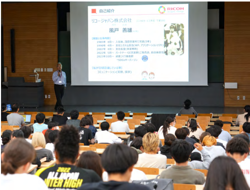
リコージャパン株式会社風戸様 講演の様子

外国語学部1年生の必修科目「外国語研究概論」において、外国語学部の学びの一環としてSDGsへの理解を深めることを目的とした講演会を開催した。