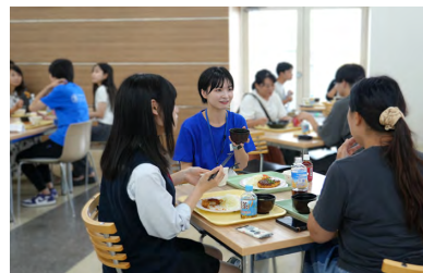
学食で参加者と談笑する学生スタッフ

7月は「歯学部1日体験」をテーマに、「模擬授業」「キャンパスライフガイダンス」などの本学をより深く知るためのプログラムを行い、8、9月は「入試ガイダンス」「総合型選抜(AO)対策講座」など、受験生向けの入試対策プログラムをメインに実施した。