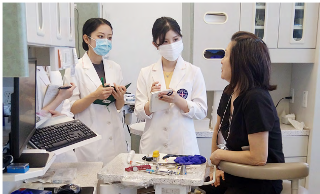
口腔保健学科の研修の様子