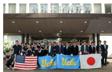
正面玄関での集合写真

“Digital workflow and education in UCLA Restorative Dentistry”