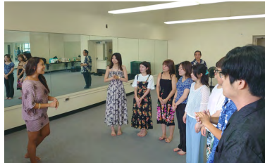
ホスピタリティ・ツーリズム学科の研修の様子

浦安キャンパスからは57人の学生が夏期海外研修に参加した。学生たちは現地大学での語学研修だけでなく、各学科の学びに合わせて、企業への訪問や現地文化に触れるフィールドワークなど、多彩なプログラムに参加した。日頃の授業だけでは得られない貴重な体験や、研究分野の理解を深める生きた知識に触れることができ、国際未来社会に目を向ける良い機会となった。