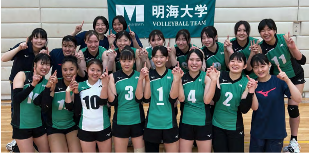
女子バレーボール部

今季から関東大学女子1部バレーボールリーグのステージに立った本学体育会女子バレーボール部は、9月から10月にかけて行われている「2024年度秋季関東大学女子1部バレーボール