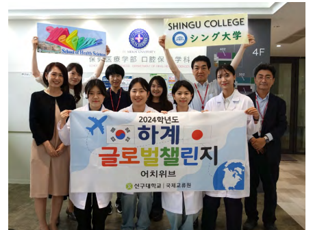
シング大学の学生と保健医療学部の教員たち

導実習」および「基礎歯科診療補助実習」を見学した後、保健医療学部の教員や学生に本学での歯科衛生士養成カリキュラムや日本の歯科衛生士を目指す学生の様子についてインタビューを行った。学びへ積極的な姿勢を見せるシング大学の学生たちに、本学の学生たちも良い刺激を受けた様子が見受けられた。