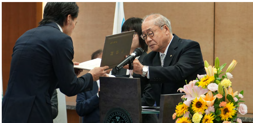
中寫学長から学位記を受け取る卒業生

入学式に続いて挙行政された9月卒業式・学位記授与式では、学部生22人、大学院生1人、別科日本語研修課程の学生1人が卒業・修了を迎え、中寫学長から一人ひとりに学位記が授与された。中寫学長は「常に化する社会を生きていくために、建学の精神を振り返り、未来に大きく寄与してください。また、明海大学の卒業生として誇りを持ち、今までの概念にとらわれずに個性を發揮し、皆様がこれからの社会で活躍することを祈念します」と門出を迎えた卒業生たちへ激励の言葉を送った。