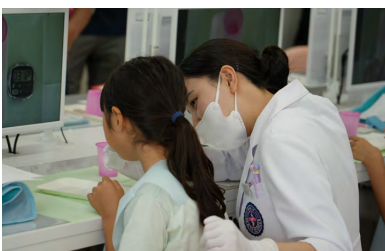
実習でコップに唾液を集める様子