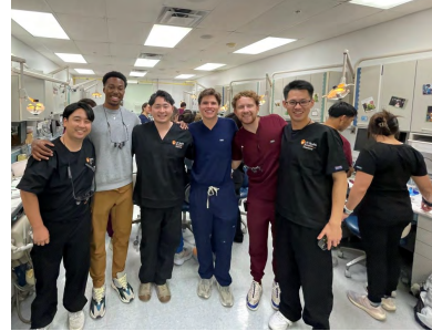
テキサス大学サンアントニオ校

坂戸キャンパス(歯学部)からは、22人の学生が海外研修に参加した。研修期間中は派遣先大学のキャンパスや病院施設の見学をし、日本のシステムとの相違を知るとともに、実習に参加して現地の医療制度への理解を深めたり、現地学生たちの姿に刺激を受けたりと、充実の研修期間を過ごした。また、休日には現地学生たちのアテンドにより観光地を訪れるなど親睦を深め、友情を育む学生の姿も見られた。