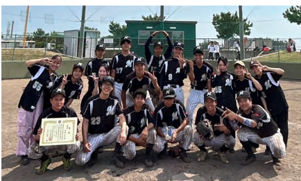
歯学部硬式野球部

8月1日から6日にかけて、みなと堺グリーンひろば硬式野球場(大阪府堺市)で開催された「第56回全日本歯科学生総合体育大会」において、硬式野球部が見事準優勝に輝いた。1回戦は朝日大学に32-0、2回戦は九州歯科大学に14-7、準決勝は日本歯科大