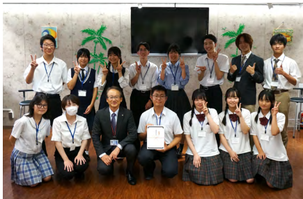
中城学部長(前列左3番目)と参加学生たち

9月8日、不動産学部主催の『2024 高校生が考える「空き不動産活用コンテスト」最終審査会』が浦安キャン